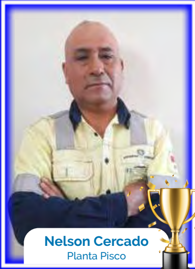
Nelson Cercado Planta Pisco